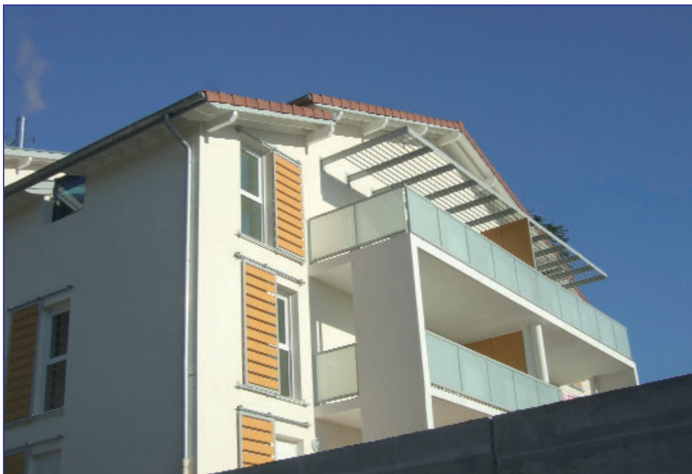
Les Cèdres, à La Tronche.

Par ailleurs, la société s'enorgueillit d'une quarantaine de tempologis.